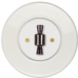
přepínač tří světel RETRO s rámečkem z bílé keramiky a designovou klíčkou

Praha 25. října 2018 - Inovativní novinku ze světa domovních vypínačů a skleněný rámeček v řadě RETRO představí na letošním jubilejním 20. ročníku Designbloku v Praze společnost OBZOR Zlín. Přepínač tří světel jako unikátní řešení spínání více světel z jednoho místa, či designově nadčasový rámeček ze skla u RETRO vypínačů... obojí je ukázkou chuti zlínského výrobce hledat v rámci elektrických vypínačů originální nové použití již zavedených materiálů a technických řešení. Jste srdečně zváni od 25. do 29. října 2018 na expozici firmy OBZOR, kterou najdete v Superstudiu na ploše s označením P44.