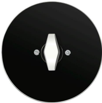
skleněný vypínač RETRO v černém provedení s kontrastní klíčkou

I druhá novinka v rámci hravé a slavicí expozice společnosti OBZOR se týká kolekce vypínačů RETRO. Nyní se ale zaměříme na materiály rámečků a to zejména ty progresivní, jakými jsou sklo a beton . „Skleněné provedení rámečku vypínačů a zásuvek v řadě RETRO je skutečně horká novinka připravovaná právě pro Designblok. Jeho nadčasová krása a elegantně luxusní vzhled na kulatém tvaru vypínačů úžasně vyniká. Barvené sklo v neutrálních odstínech bílé a černé má na spodní straně kvalitní barevný lak, který je rezistentní proti oděru a garantuje vždy stejný odstín. Sklo v této podobě působí velice čistým a jemným dojmem,“ komentuje