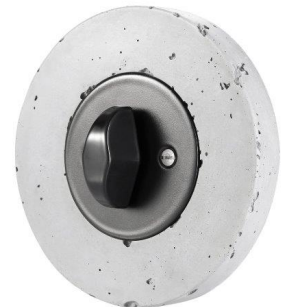
betonový rámeček vypínače RETRO

skleněnou variantu vypínačů RETRO Ing. Obadalová a uzavírá informaci o betonu, další materiálové alternativě pro tuto řadu: „Betonové rámečky se vyrábí ručně ze speciální směsi, která vyniká přítomností PVA vláken zaručující celkovou pevnost. Beton s přirozenými póry zaručuje také voděodolnost i UV stabilitu a díky povrchové impregnaci jeho povrch odolává možnému poškrábání. Těší nás, že jsme na českém trhu jediní výrobci, kteří tuto originální možnost na domovní elektroinstalaci mohou svým zákazníkům dopřát.“