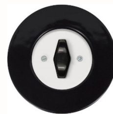
vypínač RETRO v provedení černá keramika

Vybrali jste si design vypínačů a zásuvek? Tím to ale teprve začíná... Dle typu přístroje, kterým chcete osadit stěnu, je nutné mít k dispozici i odpovídající instalační krabičku. „ Pro klasický přístroj domovního vypínače a zásuvky se nejvíce užívají krabice hluboké 30 nebo 42 milimetrů. Kvůli širší sortimentu a častým změnám v elektroinstalaci se však doporučuje instalovat rovnou hlubší krabice, abyste nemuseli zasahovat již do hotové stěny. Například naše řada RETRO má uvnitř vačkový spínač. To znamená, že pro spínače s řazením 1, 2, 5, 6 stačí krabice 42 milimetrů, avšak pro spínače řazení 7 musí být hloubka už přibližně 60 milimetrů. Stejně tak speciální přístroje jako zásuvka s přepětovou ochranou nebo žaluziový otočný ovladač musí mít montážní hloubku minimálně 50 milimetrů, “