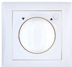
žaluziový otočný ovladač ELEGANT vyžaduje hloubku min. 50 mm

Vybrali jste si design vypínačů a zásuvek? Tím to ale teprve začíná... Dle typu přístroje, kterým chcete osadit stěnu, je nutné mít k dispozici i odpovídající instalační krabičku. „ Pro klasický přístroj domovního vypínače a zásuvky se nejvíce užívají krabice hluboké 30 nebo 42 milimetrů. Kvůli širší sortimentu a častým změnám v elektroinstalaci se však doporučuje instalovat rovnou hlubší krabice, abyste nemuseli zasahovat již do hotové stěny. Například naše řada RETRO má uvnitř vačkový spínač. To znamená, že pro spínače s řazením 1, 2, 5, 6 stačí krabice 42 milimetrů, avšak pro spínače řazení 7 musí být hloubka už přibližně 60 milimetrů. Stejně tak speciální přístroje jako zásuvka s přepětovou ochranou nebo žaluziový otočný ovladač musí mít montážní hloubku minimálně 50 milimetrů, “