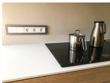
rozdělte obvody tam, kde je více spotřebičů, zejména v kuchyni a koupelně

Elektroinstalace je ovšem mnohdy zrádná věc a je důležité dopředu myslet na ochranu sebe i svého majetku. „Pro bezproblémovou funkci elektroinstalace a přístrojů celkově by se měly pečlivě rozdělovat jednotlivé elektrické obvody. Na jeden obvod připadá deset zásuvek, avšak součet výkonů zapojených spotřebičů v něm nesmí přesáhnout 3 600 wattů, pokud se překročí, dojde k vypnutí elektrického obvodu. Poradte se tedy s projektantem, a dle potřeby obvody rozdělte. S tím se pojí i funkce proudového chrániče. Tak zvané „fíčko“, měří unikající proud z obvodu. Při zjištění většího úniku chránič vypne, neboli