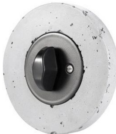
RETRO řada s betonovým rámečkem