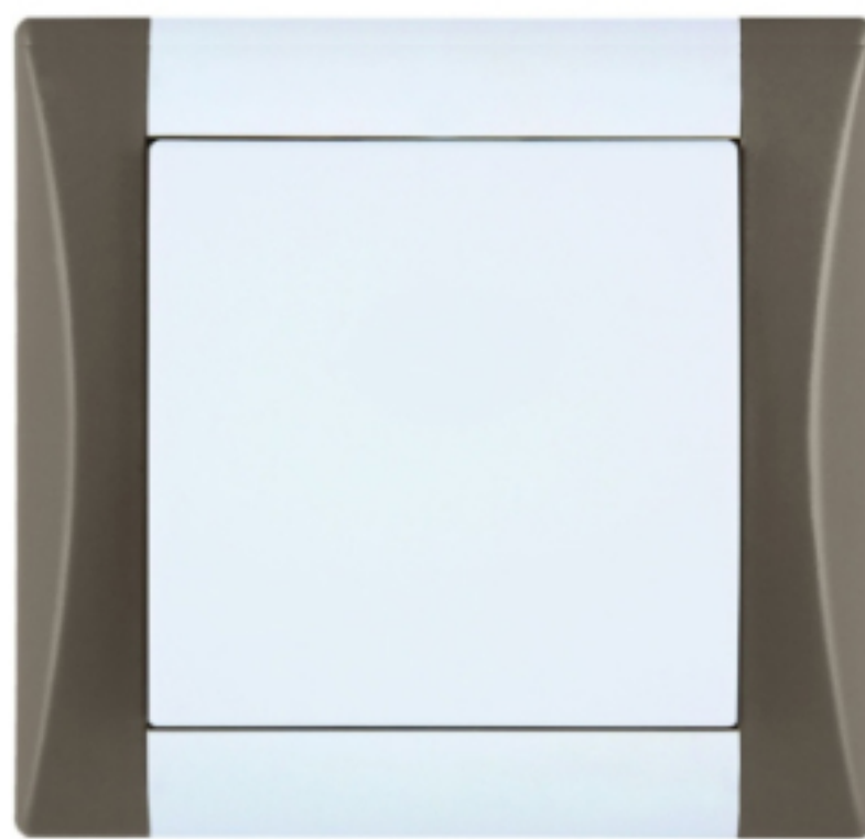
kombinovaný vypínač ELEGANT bílá / oříškově hnědá