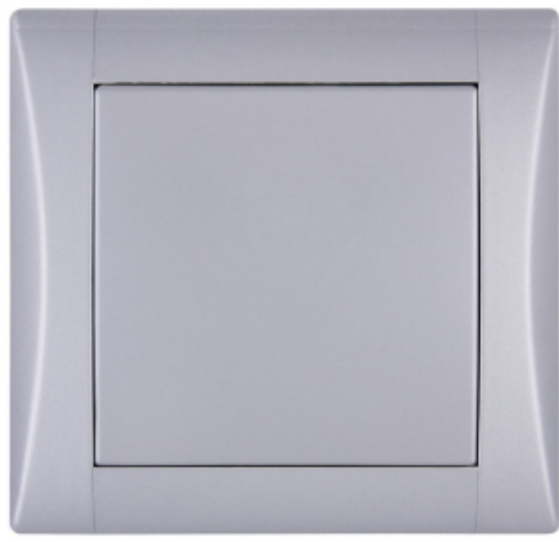
vypínač ELEGANT v metalickém odstínu hliník

Roku 2003 představilo družstvo OBZOR prvotní řadu ELEGANT. Nejen dle názvu, ale i provedení, se jedná o kolekci, která nabízí standardní řešení s dávkou elegance pro všechny interiéry. „Kouzlo vypínače ELEGANT je skryto právě v jeho jemně zaobleném designu, který padne de facto na každou stěnu. Ale tady jeho efektivita nekončí. Rámeček vypínače má odnímatelné bočnice, které dovolují zákazníkovi zkombinovat dvě barvy dle uvážení. Možností je tedy skutečně mnoho, jelikož řada obsahuje širokou barevnou škálu,“ informuje Ing. Martina Obadalová.