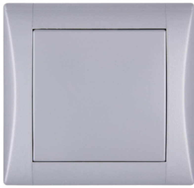
vypínač ELEGANT v metalickém odstínu hliník