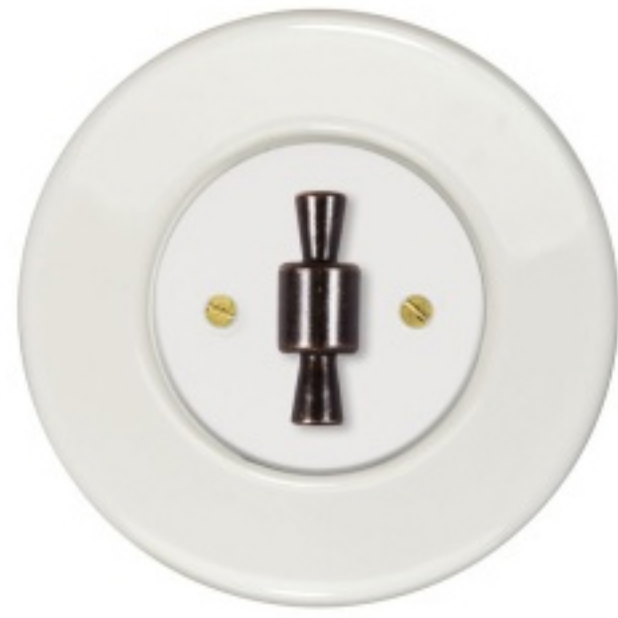
RETRO vypínač v provedení bílá keramik

Další řada RETRO z roku 2017 si našla své obdivovatele nejen díky designovému řešení, ale zejména také zvukovému projevu. „Naše RETRO vypínače charakterizuje kulatý prvorepublikový tvar s kličkou uprostřed, ale zejména cvaknutí, které po otočení ovladače uslyšíte. Typický zvuk způsobuje strojek, který jinak využíváme pro výrobu vačkových spínačů pro průmysl, na kterých je založena naše výrobní tradice. Kvalita je tedy zaručena mnohaletou praxí,“ říká Ing. Obadalová z OBZORU a dodává: „Rámečky k této kolekci je možné si vybrat v provedení bílé a černé keramiky či masivního dubového nebo bukového dřeva. Avšak i tady se sortiment rozšířil o novinky, a to o beton a sklo.“