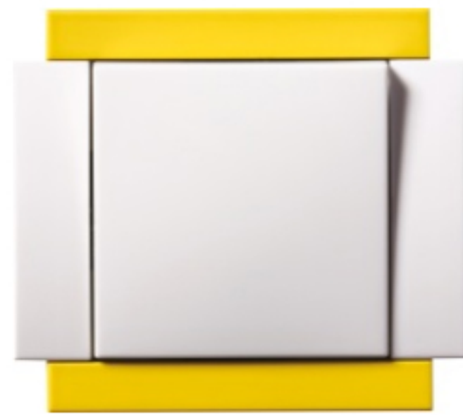
vypínač VARIANT s bočnicemi v citrusově žlutém odstínu

„Tato řada evokuje optimistickou náladu svými sytými barvami základního rámečku, které velmi okázale kontrastují s neutrálními odstíny středových krytů a bočnic. Tento hravý a trochu bláznivý design sluší zejména dětskému pokoji, ale dobře vypadá i na zdech pop artové místnosti či ateliéru,“ upřesňuje Ing. Obadalová z OBZORU.