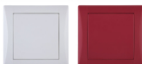
Barvy na vypínači ELEGANT mohou mít také světlý nádech kouřově šedé nebo naopak sytý odstín rubínově červené

„Barevným požadavkům moderní doby se přizpůsobila řada ELEGANT, která ve své paletě skrývá opravdu široké spektrum odstínů, ze kterých si vybere milovník jakékoliv barvy,“ říká Ing. Obadalová a dále specifikuje: „U kolekce ELEGANT se barevné meze skutečně nekladou. Pokud sledujete to, co je zrovna „in“, vybrat si můžete odstíny jako ocelově šedá, cappuccino, sněhově bílá či metalický grafit, hliník nebo titan. Pokud sníte o barevnější přesto decentnější variantě, vanilkově žlutá, pískově béžová či kouřově šedá vám hned učaruje. A pokud jste obdivovatel sytých barev i kontrastů, vyberete si z nepřehlédnutelných odstínů slunečnicově žluté, rubínově červené nebo temně modré.“ S tak bohatými možnostmi barevných variant si velice jednoduše dokážete vykouzlit jedinečnou harmonii prakticky v každé místnosti.