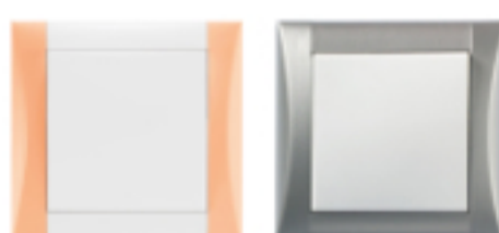
Vypínače ELEGANT v kombinacích oblíbené bílé a broskvově oranžové na bočních či metalického hliníku po celém obvodu rámečku, zdroj: Obzor Zlín

U barevných hrátek v jedné barvě se ale v řadě ELEGANT nekončí. Lze si totiž na jeden vypínač nakombinovat hned dva odstíny. „Kolekce nabízí možnost, vybrat si na pohledové části dokonce dvě barvy a ty si rozvrhnout dle libosti. Jinou barvu může mít vrchní krytka, celý rámeček nebo jen jeho boční části,“ informuje Ing. Obadalová z OBZORU a dodává: „Toto je další možnost, jak si s barvami na vypínači originálně pohrát. Kromě toho, pokud by se vám časem zdálo, že barvy na vašem vypínači už nejsou dostatečně trendy, lze jeho pohledové části, tedy rámeček s krytkou, snadno sejmout a nasadit na stejný strojek tyto nové.“