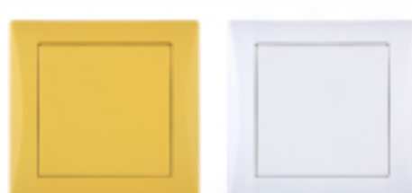
Výrazný odstín slunečnicově žluté i stále oblíbená bílá na moderním vypínači ELEGANT

V sortimentu domovních vypínačů stále hrají prim ty s rámečky a kryty z plastů. I přes to však panují obavy spojené s jejich lámavostí a barevnou stálostí. „Dnešních plastových vypínačů se z těchto důvodů není třeba obávat. Jednotlivé komponenty řady ELEGANT se vyrábí z vysoce kvalitního plastu, polykarbonátu, který zaručuje kolekci vysokou pevnost a vytrvalost. Kromě toho je materiál také barevně stálý a odolný,“ komentuje závěrem moderní plastové materiály Ing. Martina Obadalová.