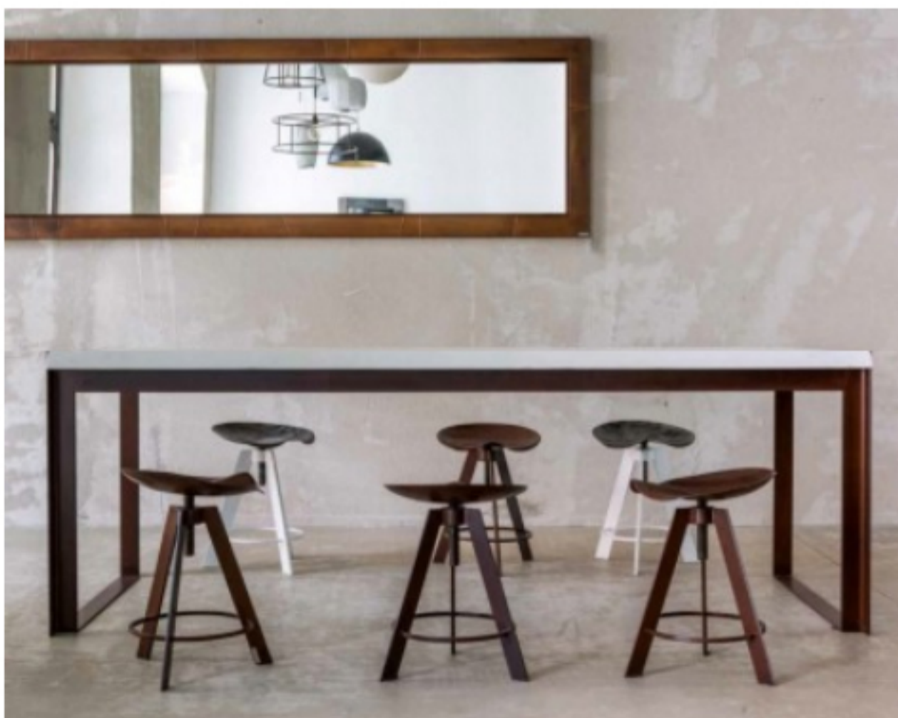
Výjimečnou atmosféru industriálního stylu podtrhují betonové stěrky na stěnách i podlahách.