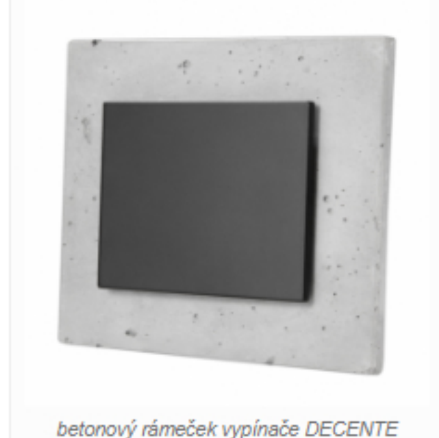
betonový rámeček vypínače DECENTE