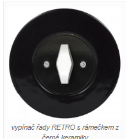
vypínač řady RETRO s rámečkem z černé keramiky

Retro spojuje výrazné barvy i vzory, které se odráží na stěnách, nábytku i v doplňcích. Vypínače by tedy měly být stylizované v duchu nápaditosti, přesto neutrální, ty moderní tohle umí velmi dobře. Retro vypínače s kulatým rámečkem z klasických i industriálních materiálů vnášejí do prostoru originalitu i osobitý nádech.