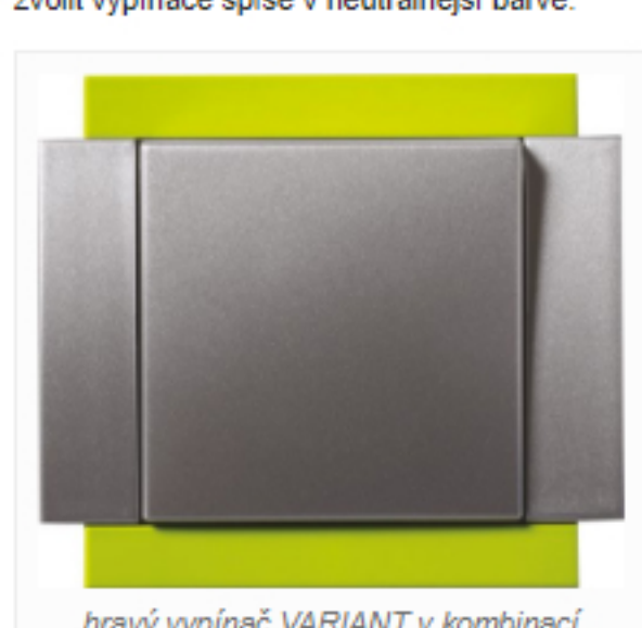
hravý vypínač VARIANT v kombinaci odstínů limetkově zelené a hliníku

Tento styl si většinou hraje s barvami i tvary a takové mohou být i vypínače, tyto prvky z nich totiž umí vykouzlit designový skvost. S barvami se to však nemá přehánět. Pokud interiér překypuje různými odstíny, je vhodnější zvolit vypínače spíše v neutrálnější barvě.