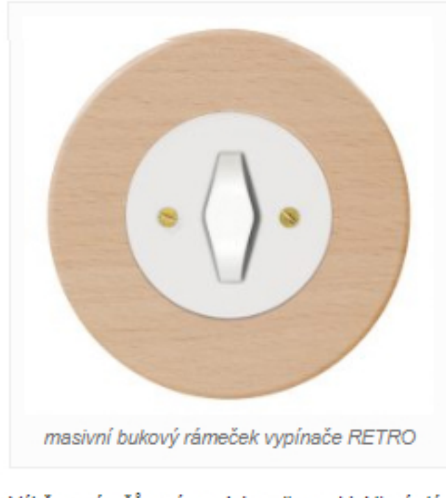
masivní bukový rámeček vypínače RETRO