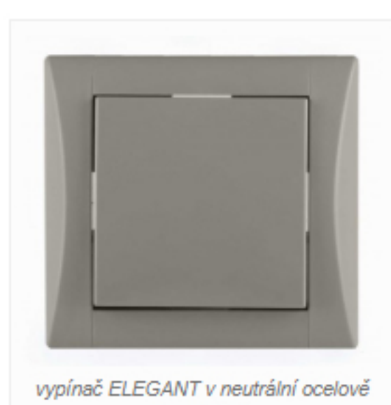
vypínač ELEGANT v neutrální ocelově šedé barvě

U tohoto stylu vytváří útulný efekt právě doplňky a barevné sladění. Vypínače by se měly vybírat spíše v tlumených, jemných odstínech, nerozbijející atmosféru. Tím se zvyšují možnosti pro další ladění třeba s další doplňkovou barvou.